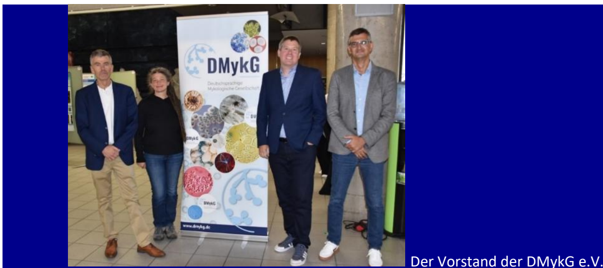
Der Vorstand der DMykG e.V.