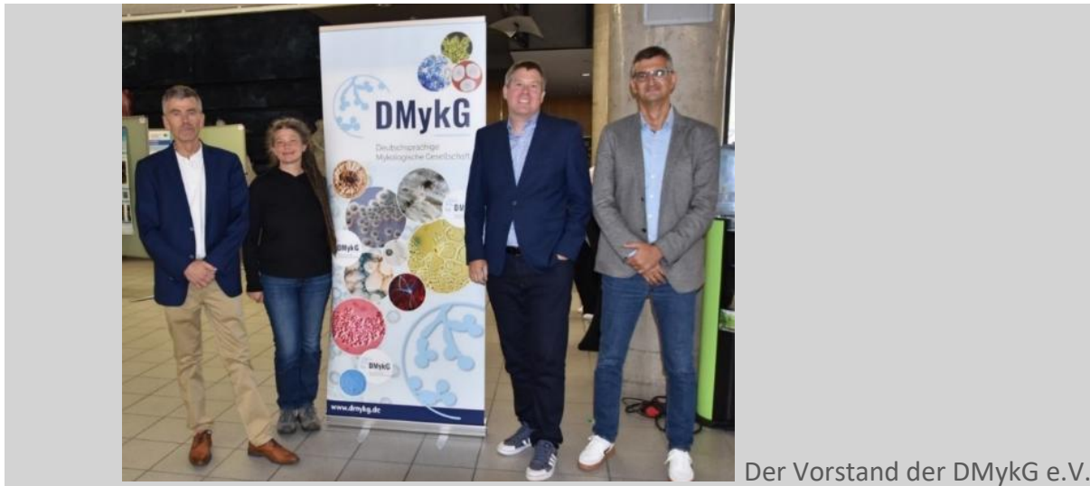
Der Vorstand der DMMyG e.V.

Wir wünschen Ihnen einen schönen Sommer und eine erholsame und entspannte Ferienzeit! Herzlichen Dank für Ihr Interesse und viele Grüße