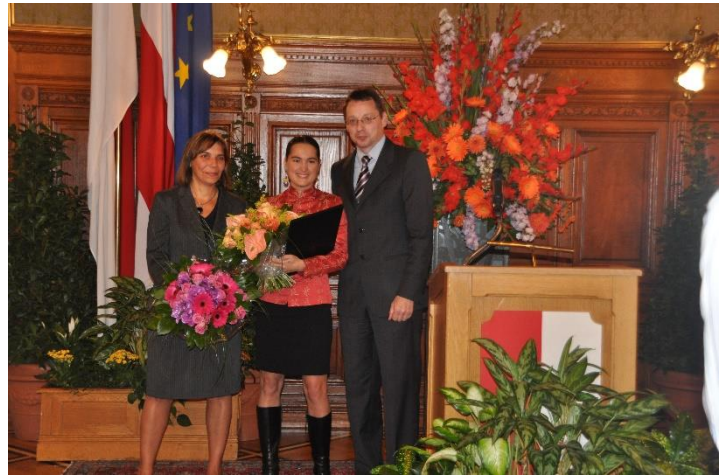
Preisverleihung im Rahmen der MYK 2010*