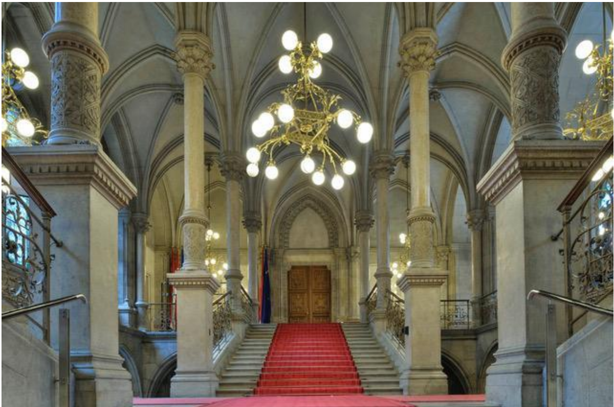
Hinauf zum Steinsaal führt die imposante Feststiege

Im Wiener Rathaus finden seit der 1990er Jahre zahlreiche Festlichkeiten statt und es wurde im Laufe der Zeit zum Zentrum der Wiener Ballsaison. Im Arkadeninnenhof befindet sich ein Sommerkaffeehaus, das „Arkaden-Cafe“.