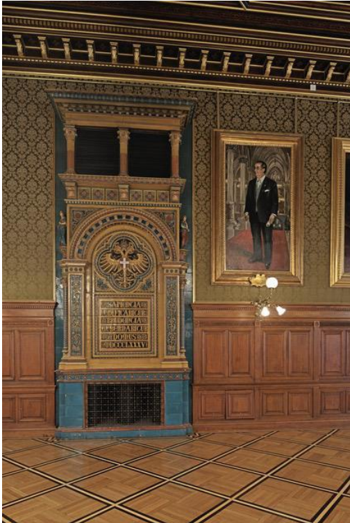
Kamin im Stadtsenatssitzungssaal